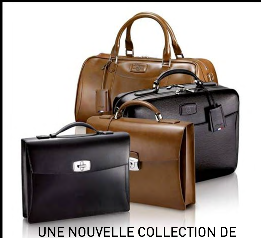
UNE NOUVELLE COLLECTION DE MAROQUINERIE S.T.DUPONT "LIGNE D ELYSEE"