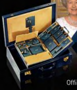
Official Wedding Travel Case