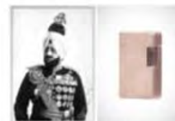
The Maharajah of Patiala and the first S.T. Dupont lighter

S.T. Dupont owes one of its greatest successes, the Dupont lighter, to the Maharajah of Patiala, who ordered one hundred Chinese lacquer minaudière clutch bags for his consorts, each one to contain a solid gold lighter.