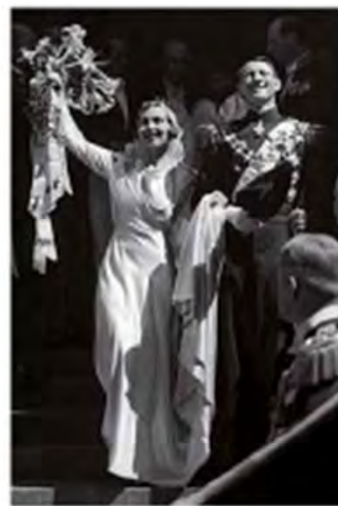
Ingrid, Queen of Denmark