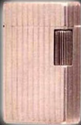
Le premier briquet S.T. Dupont

LA REFERENCE ABSOLUE DANS LE BRIQUET DE LUXE