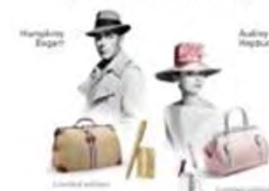
Limited edition Limited edition

This year, S.T. Dupont is celebrating 140 exceptional years spent serving the great and the grand, an event which will combine the present with the best of the past.