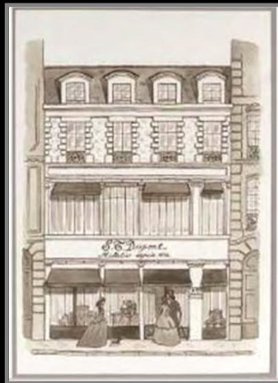
Boutique Rue Dieu