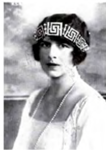
Elena, Queen of Romania