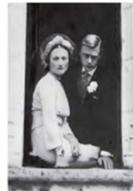
Duke of Windsor