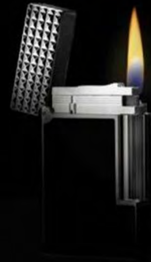
TEST du Feu