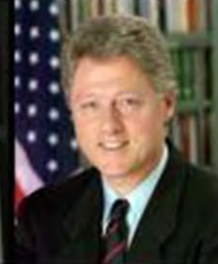
Neo Classic President Pen