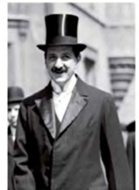
Frank Jay Gould