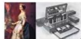
The Empress Eugénie and her travel case