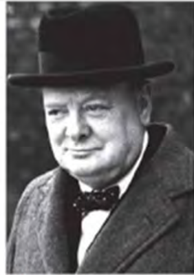
Sir Winston Churchill