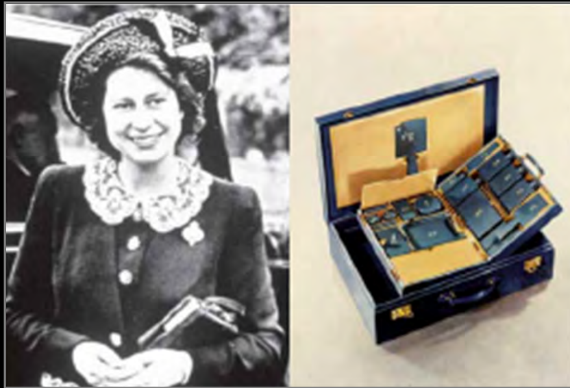
Cadeau de mariage d'Elisabeth II.