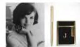
Jackie Kennedy and her lighter engraved with a J and the first S.T. Dupont pen

Jackie Kennedy-Onassis also had a Dupont lighter. It was engraved with a simple 'J'. She loved it so much that in 1973 she ordered a pen to match. And another Dupont icon was born: the «Classique» pen. The workshop now turned its exceptional craftsmanship from lighters to writing instruments. New product, new sensation: people loved the