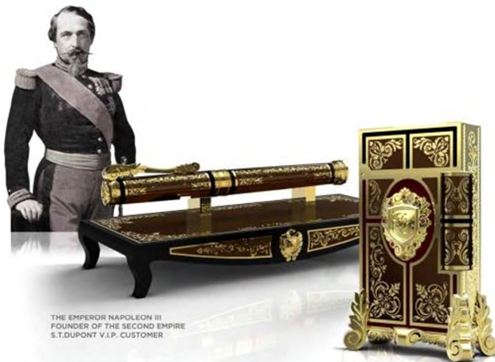
THE EMPEROR NAPOLEON III FOUNDER OF THE SECOND EMPIRE S.T.DUPONT V.I.P. CUSTOMER

IN 1872, SIMON TISSOT DUPONT HIMSELF CREATED LUXURIES FOR NAPOLEON III. TODAY, S.T.DUPONT CELEBRATES HIS LEGACY, WITH THE SECOND EMPIRE LIGHTER AND PRESTIGE PEN SET. INLAID WITH PALE GOLD AND FESTOONED WITH RUBIES THAT RECALL A THOUSAND GLORIOUS STORIES. STORIES YOU CAN NOW MAKE YOUR OWN.