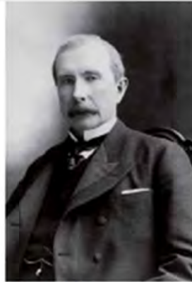
John D. Rockefeller