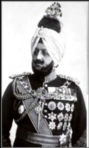
Le Maharajah de Patiala