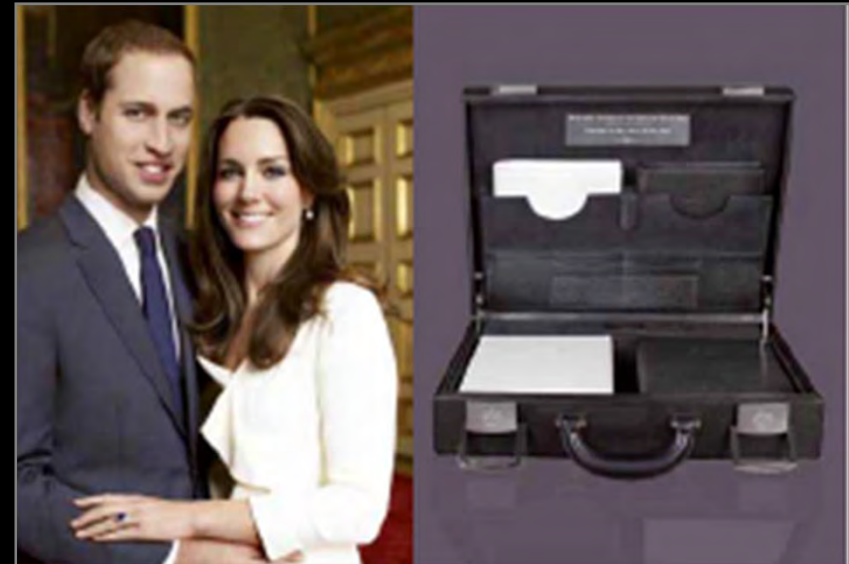
S.T.Dupont a encore été choisi pour fournir le cadeau de mariage officiel du Prince William & de la duchesse de Cambridge