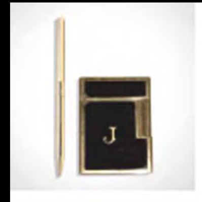
Le briquet "J" & le premier stylo S.T. Dupont

LE PREMIER STYLO DE LUXE: " LE CLASSIQUE "